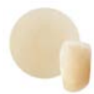
+ Cerâmicas de injeção