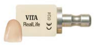
+ Blocos de cerâmica feldspática de estrutura fina