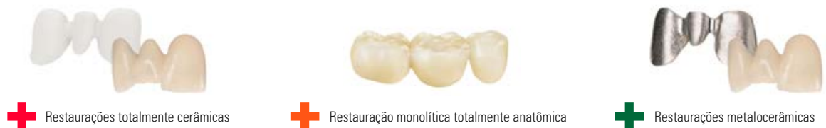
+ Restaurações totalmente cerâmicas